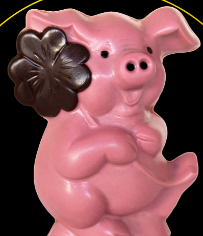
COCHON RUBY 7431 - 13 CM - 150 G CHOCOLAT AU LAIT ENROBÉ DE CACAO RUBY